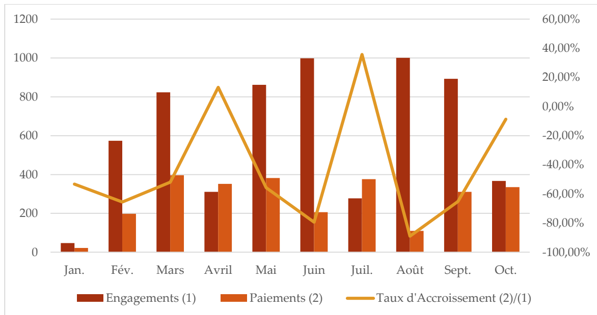
Figure 3 : EVOLUTION DES PAIEMENTS/ENGAGEMENTS